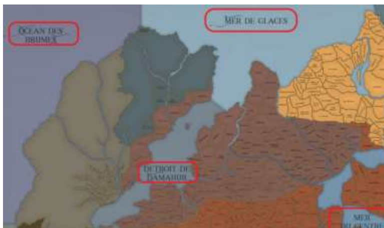
Figure 2: Exemple de provinces maritimes (coin nord-ouest de la carte du monde connu)

Le monde de l'Hippocampe contient plusieurs étendues d'eau. Celles-ci, incluant les mers, rivières et fleuves, sont regroupées en provinces maritimes. Les provinces maritimes représentent les étendues d'eaux connues adjacentes aux régions connues du monde de Bicolline. Les mers du monde de l'Hippocampe dépassent les confins de la carte géopolitique connue. Les déplacements maritimes hors de cette zone cartographiée relèvent des quêtes. La navigation hors des provinces maritimes est l'apanage de navigateurs légendaires qui osent risquer leur vie et leur vaisseau.