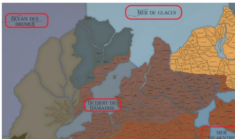
Figure 2: Exemple de provinces maritimes (coin nord-ouest de la carte du monde connu)

Chaque province maritime peut être revendiquée par un amiral lors des élections maritimes annuelles. L'amiral gagnant reçoit le titre de noblesse de seigneur maritime. Les provinces maritimes peuvent changer d'allégeance de région annuellement au gré de la volonté de leur seigneur maritime, une particularité offrant un contraste avec la stabilité des provinces terrestres.