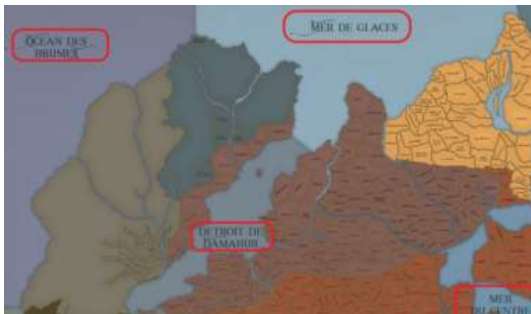
Figure 3: Exemple de provinces maritimes (coin nord-ouest de la carte du monde connu)

Le monde de l'Hippocampe contient plusieurs étendues d'eau. Celles-ci, incluant les mers, rivières et fleuves, sont regroupées en provinces maritimes. Les provinces maritimes représentent les étendues d'eaux connues adjacentes aux régions connues du monde de Bicolline. Les mers du monde de l'Hippocampe dépassent les confins de la carte géopolitique connue. Les déplacements maritimes hors de cette zone cartographiée relèvent des quêtes. La navigation hors des provinces maritimes est l'apanage de navigateurs légendaires qui osent risquer leur vie et leur vaisseau.