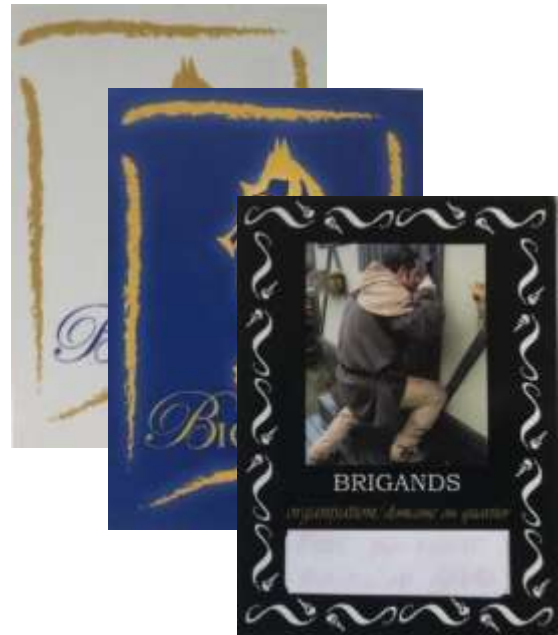
Figure 1: Exemples de cartes avec le contour noir qui seront retirées après la Grande Bataille 2022