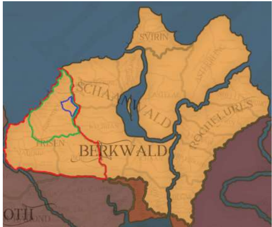
Figure 2: Exemple du découpage d'une province

Les différentes divisions géopolitiques sont décrites dans les sous-sections qui suivent.